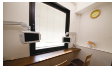
リクライニングチェアと前処置室