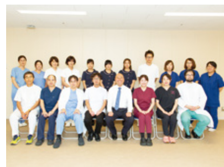
消化器内科医師と内視鏡室スタッフ