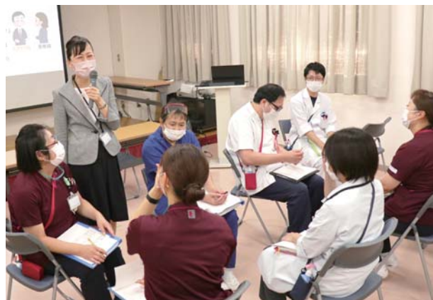
受講者のロールプレイの様子

2021年4月より、当院スタッフに対し接遇の基本「笑顔・アイコンタクト・挨拶」について第一印象をアップする研修を実施しています。