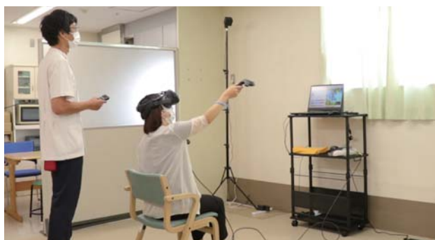
「mediVR カグラ」体験の様子

このたび、VR(仮想現実)を活用した機器「mediVRカグラ」を導入しました。これは、リハビリテーションをサポートするための先端的な医療機器です。座ったままゲームを楽しみながら、姿勢バランスや歩行・認知機能を改善することが期待できます。適応のある方にご提案させていただきます。