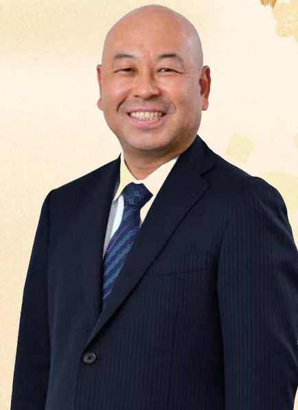
社会医療法人祐生会 理事長

当院と地域のかかりつけ医の先生方との連携を深め、より一層充実した医療を受けていただけるよう環境整備を図る病院