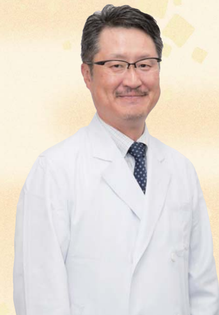
社会医療法人祐生会 みどりヶ丘病院 院長

結びに、皆さんにはこれまでと変わらぬご支援、ご鞭撻を賜りますよう心からお願い申し上げます。