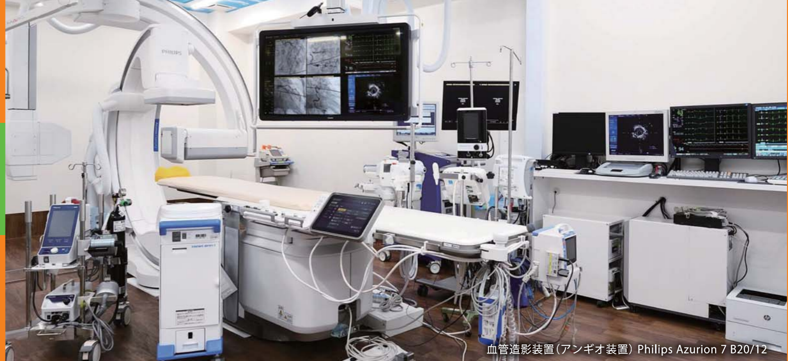
血管造影装置(アンギオ装置) Philips Azurion 7 B20/12

足の血管が浮き出ている、だるさが気になるなど、足のトラブルに悩まされていませんか。もしかしたら「下肢静脈瘤」かもしれません。当院では昨年9月から下肢静脈瘤外来を開設し、専門の資格を持った医師と看護師が治療にあたっています。今号では、下肢静脈瘤についてご紹介します。