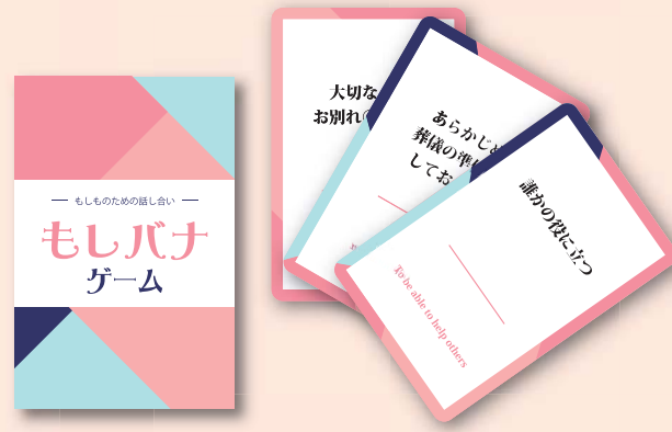
イラストはイメージです

「もしバナゲーム」とは、1セットに36枚のカードがあり、カードには「いい人生だったと思える」「ユーモアを持ち続ける」「信頼できる主治医がいる」「家族と一緒に過ごす」「ひととの温かいつながりがある」「誰かの役に立つ」「痛みがない」「生死観について話せる」「機械につながっていない」「大切な人とお別れができる」など自分にとって何が大切で、どのようにケアして欲しいのかなど、重病の時や死の間際に大事なことで人がよく口にすることが書いてあります。もし余命が半年から一年だとしたら、自分にとって重要だと思われるカードを手元に残し優先順位をつけて話していくというものです。もしもに備えて、自分や家族の想いや願いを知り、理解してもらおうきっかけに活用してみてください。