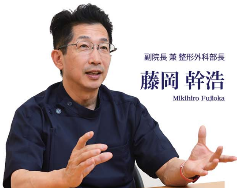
副院長 兼 整形外科部長

まずはご相談ください。受診していただければ患者さんそれぞれの病態、病期、活動性、社会状況などを考慮し、最も適切な治療法を提示いたします。早期に手術を受けた方が良いのか、待機しても大丈夫なのかを判断するための大切な出会いをお待ちしたいと考えています。コロナ禍が明けたときには旅行もスポーツもできるようになって人生を謳歌しましょう。そして、若々しく歩いて友達をびっくりさせてみようではありませんか！